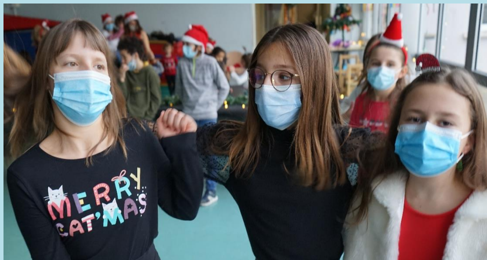
Le bal de fin d'année de l'accueil de loisirs – Mercredi 16 décembre 2020

En tenue de fête, les enfants de la Ruche, ont fait un défilé, puis ils ont dansé, joué et dégusté un goûter de fête ! Ambiance survoltée mais masquée !!