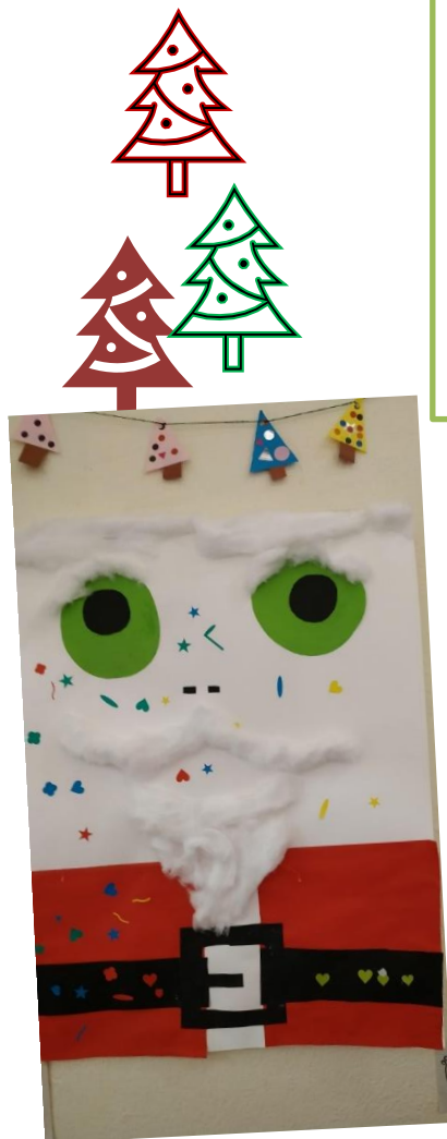
Le Père Noël et le sapin des enfants de 3- 6 ans de l'accueil La Ruche